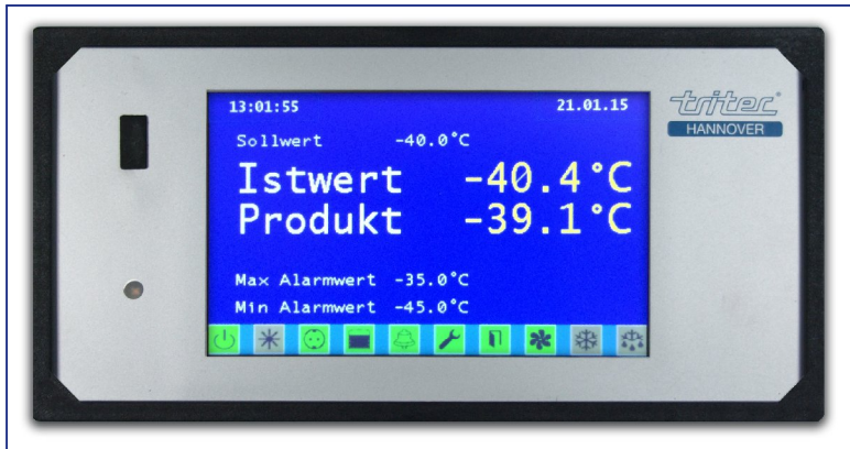
Benutzerfreundlich, intuitiv bedienbar