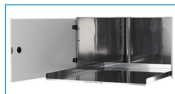
ausziehbarer, kippsicherer Einlegeboden