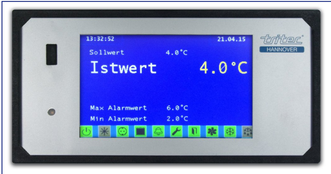
Benutzerfreundlich, intuitiv bedienbar